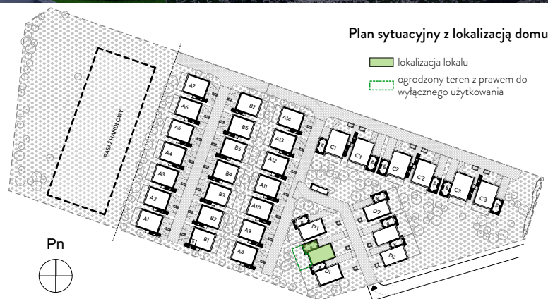
Plan sytuacyjny z lokalizacją domu