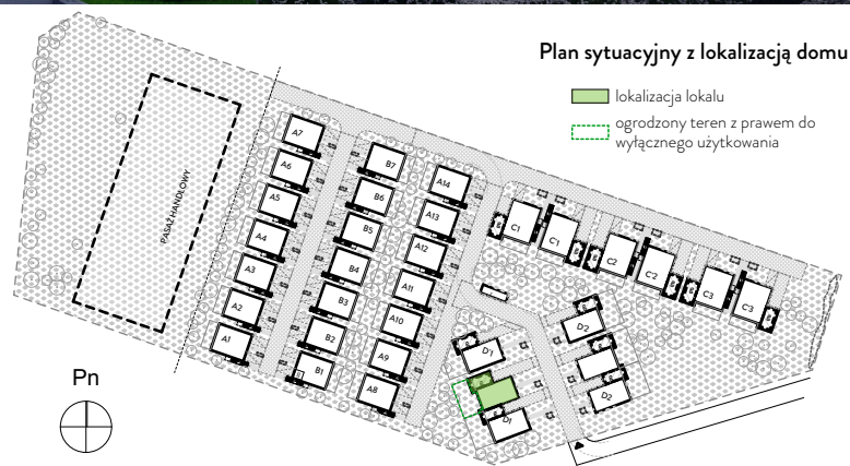
Plan sytuacyjny z lokalizacją domu