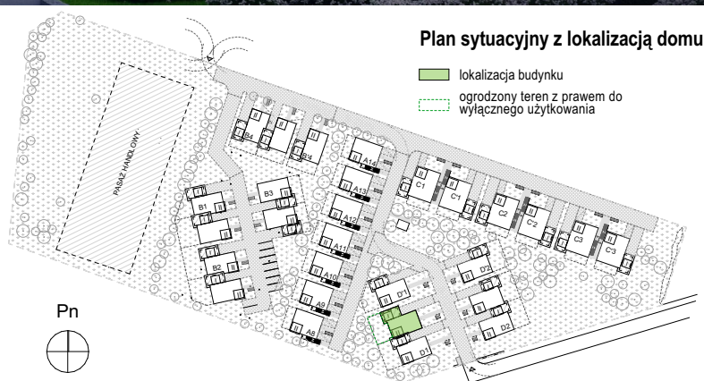
Plan sytuacyjny z lokalizacją domu